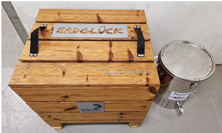
Abbildung 4: Wurmbox im Büroceller