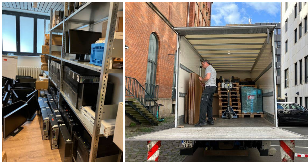
Abbildung 3: Unser Beitrag zum Umweltschutz durch IT-Remarketing

2023 haben wir zur Lebensmittelverwertung ein Nachhaltigkeitsprojekt mit dem lokalen Projektpartner Langes Gemüseglück eingeführt. Seit dem Sommer 2023 betreiben wir eine lokale Kompostieranlage für die Lebensmittelabfälle aus unseren Büroküchen bei uns im Keller. Unsere eigene Wurmfarm im Keller produziert aus den Lebensmittelresten der Küchen und Kaffeestationen nachhaltigen Wurmhumus, der als Dünger für die Pflanzen der Mitarbeiter zuhause verwendet werden kann.