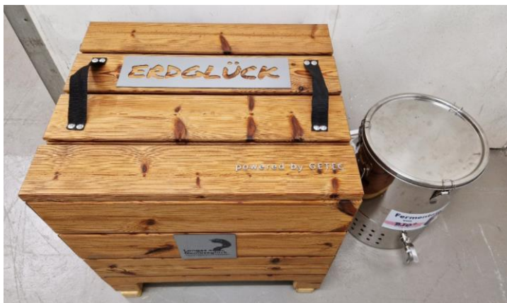
Abbildung 4: Wurmkiste im Bürokeller