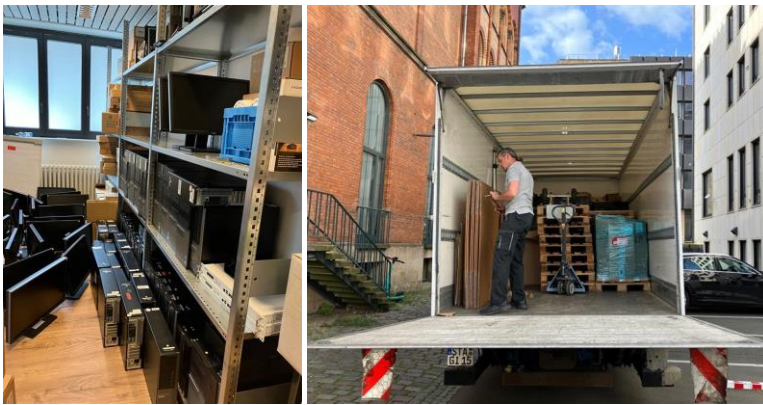
Abbildung 3: Unser Beitrag zum Umweltschutz durch IT-Remarketing

2023 haben wir zur Lebensmittelverwertung ein Nachhaltigkeitsprojekt mit dem lokalen Projektpartner Langes Gemüseglück eingeführt. Seit dem Sommer 2023 betreiben wir eine lokale Kompostieranlage für die Lebensmittelabfälle aus unseren Büroküchen bei uns im Keller. Unsere eigene Wurmfarm im Keller produziert aus den Lebensmittelresten der Küchen und Kaffeestationen nachhaltigen Wurmhumus, der als Dünger für die Pflanzen der Mitarbeiter zuhause verwendet werden kann.